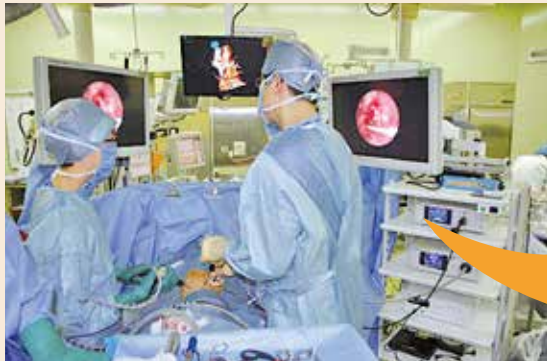
肺がんに対する細径胸腔鏡下手術の場面

今、 Reduced Port Surgery と言う、より小さい傷で手術する、より 低侵襲な内視鏡外科手術 が注目を集めています。 Needlescopic Surgery (細径胸腔鏡下手術) はその一種で、当センターでは3mmのスコープと2mmの鉗子を用いて、気胸から肺がんまで呼吸器外科手術全般を行っています。従来法より術創が小さく痛みが少ないのが特徴です。