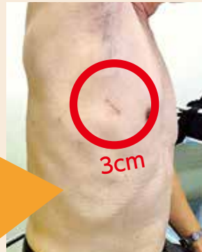
細径胸腔鏡下右上葉切除術の術後2週の術創